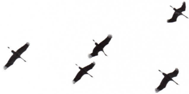
Ágocs József: Darvak