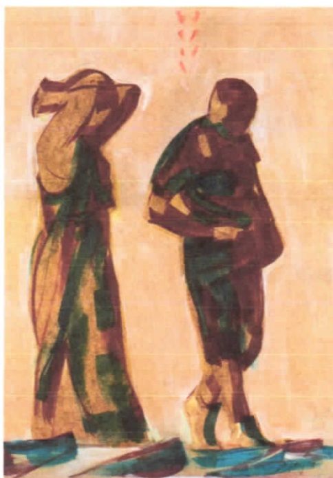
SONKOLY TIBOR: Közeledési lehetőségek III. vegyestechnika, farostlemez 100 x 70 cm