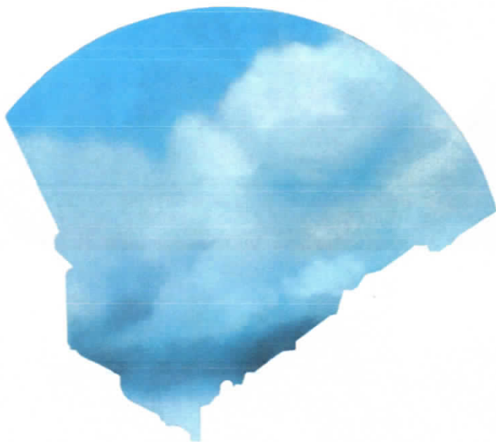
KONDOR ATTILA: Figyelem (Városi táj) olaj, rétegelt falemez 42 x 50 cm