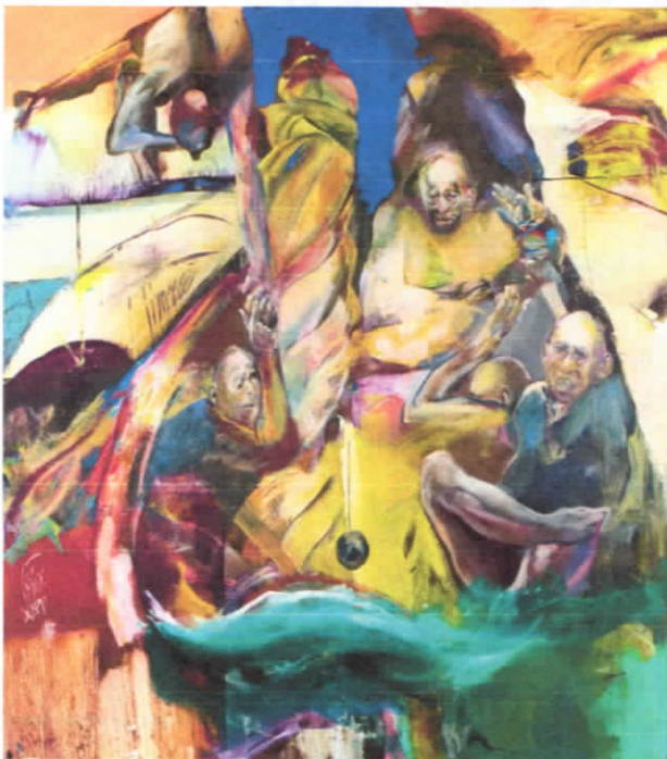
KÉRI LÁSZLÓ: Kapaszkodók olaj, vászon 170 x 150 cm