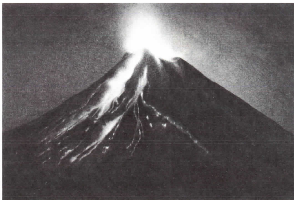
GALLOV PÉTER: Vulkán I. (Hommage à The Black Scorpion) grafit, papír 11 x 16 cm