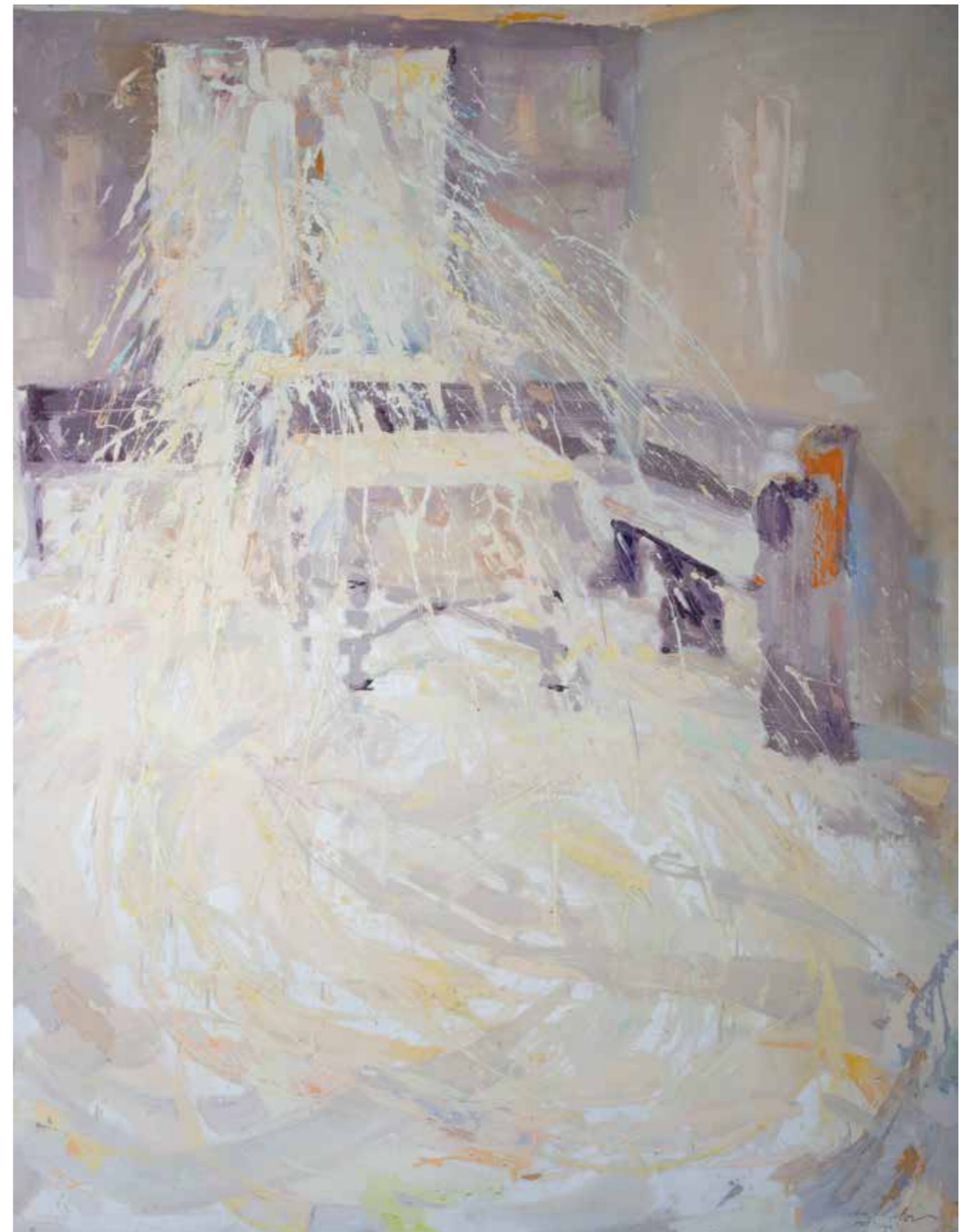
Atlasz Gábor: Miskei vendég