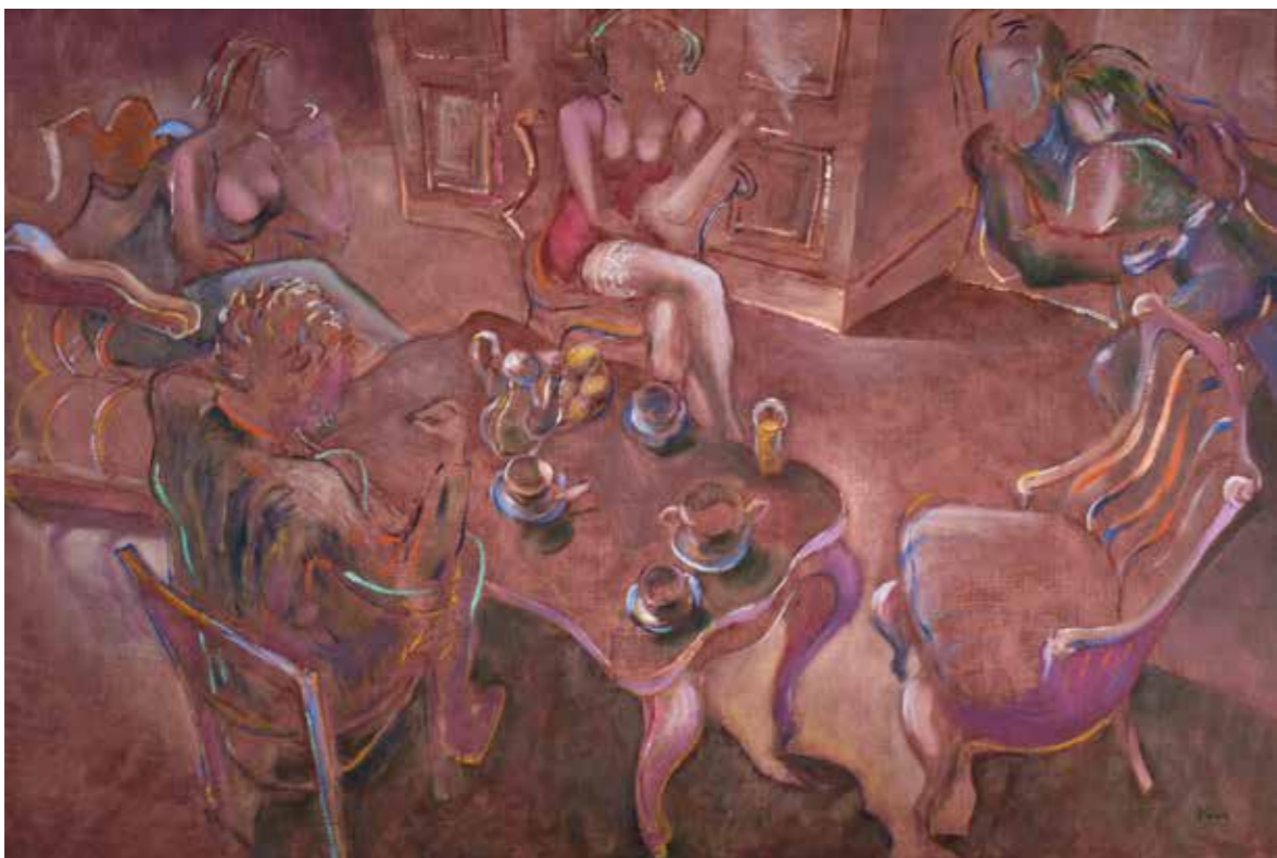
Kelemen Marcell: Viszonyok I.