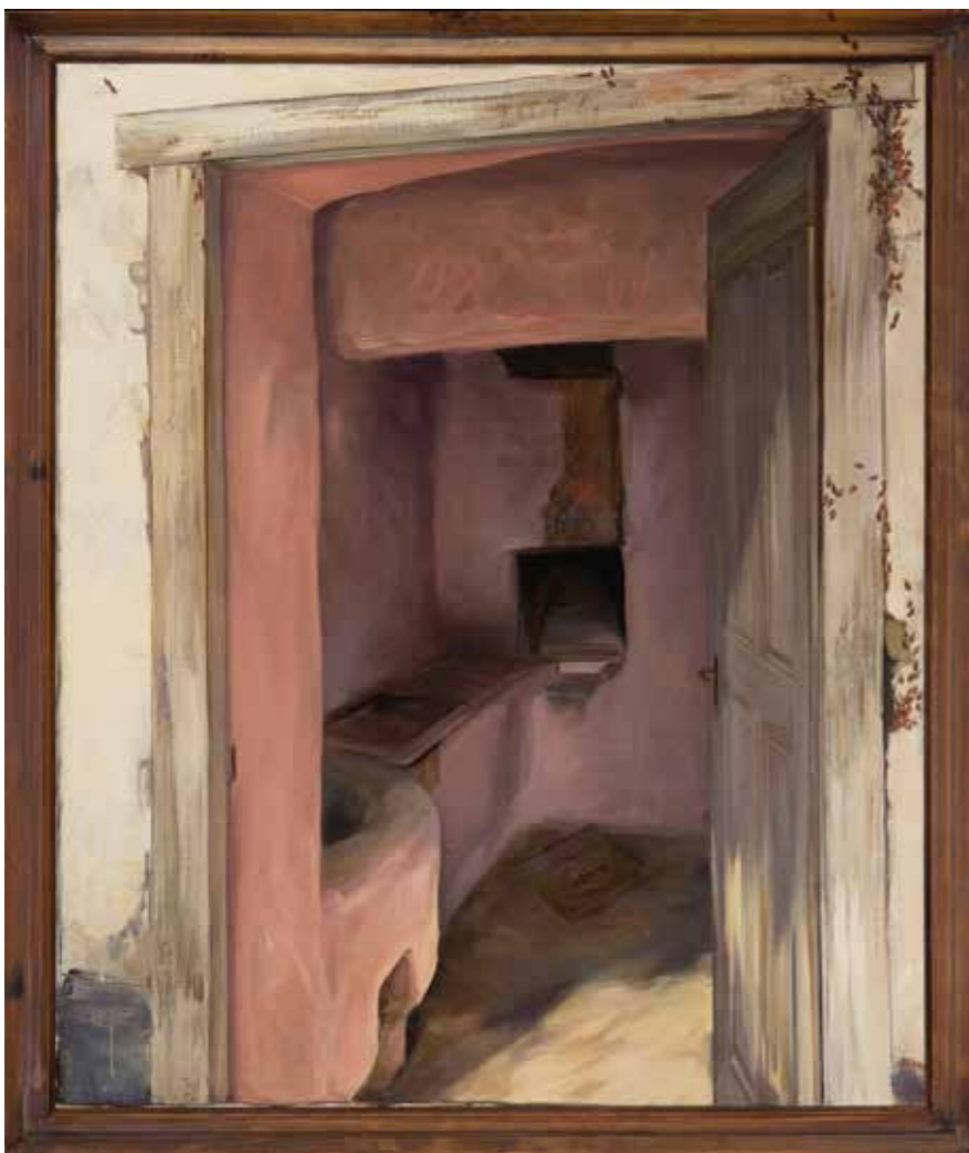
Balogh Gyula: A kenyér helye