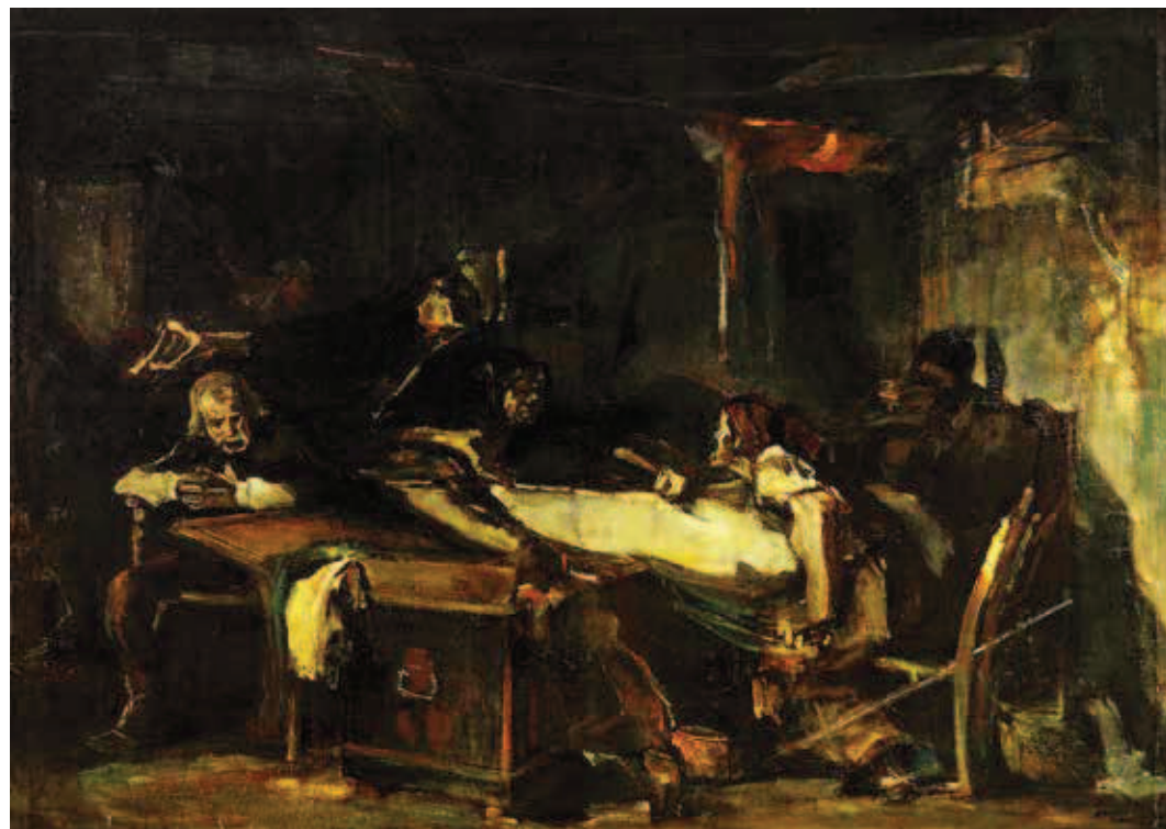
Juss. 1910 körül. 205 x 290 cm. olaj, vászon. Jelezve jobbra lent: Tornyai Tornyai János Múzeum, ltsz.: 55.408